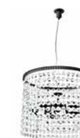
415 S60 lampadario hanging lamp Ø 60 H. 54 cm