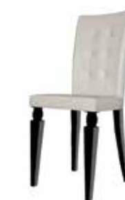
3A SL/TM sedia chair L. 50 H. 91 P. 57 cm