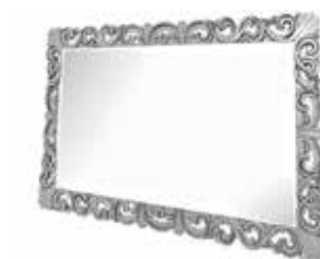
10A SFAL specchiera mirror 125 x 95 cm