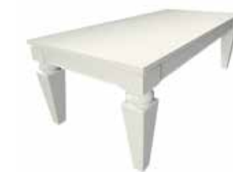
2A TL/BI tavolo laccato bianco white lacquered table L. 200 H. 75 P. 100 cm