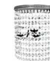
415 A2 applique sconce