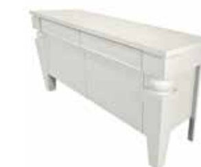
5A ML/BI madia sideboard L. 150 H. 75 P. 50 cm