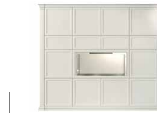
1A LI/CB libreria Infinity Infinity bookcase L. 284,6 H. 255,4 P. 33,4 cm