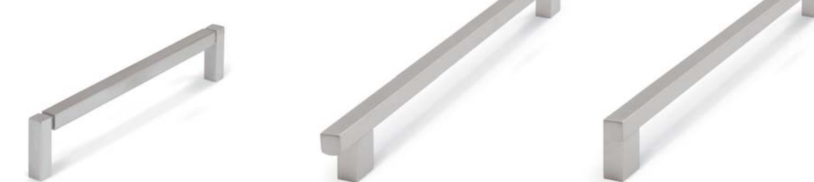
NICKEL SATINATO PICCOLA PER CASSETTI